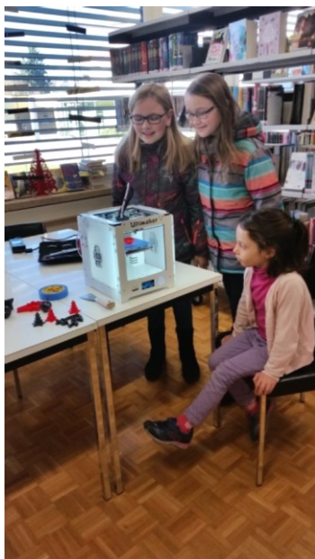
Abbildung 13D-Drucker und Lego-Technik am Makerspace-Tag