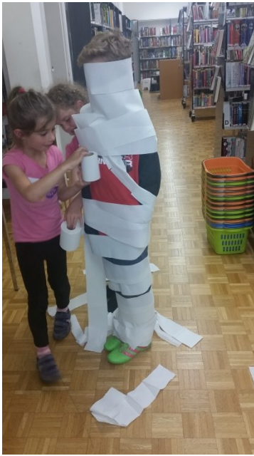
Ferienspass - Gespensternacht