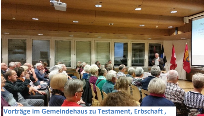
Vorträge im Gemeindehaus zu Testament, Erbschaft , Patientenverfügung und Vorsorgeauftrag