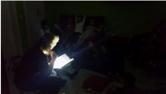
Vorlesen an der Gespensternacht