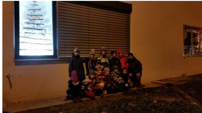
Adventsfenster der 1. Klasse von Marco Buchmüller